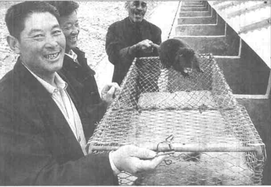
东营区牛庄镇富民示范基地大力发展特种养殖，他们从去年购进400对狸獭，经过精心繁育，获得成功。在他们的带动下，全镇已有近百户农民搞起了特种养殖，共同走上了一条特种养殖的新路子。

东方花卉公司的崛起，为全县的花卉产业起到了很好的示范带动作用，并且为科技种花提供了有力的技术支持和良种保证。 经过几年的发展，全县已逐步形成了以东方花卉公司、绿洲花木公司、福泰花卉等企业为龙头，以潍博路、青垦路、辛河路三条主干线为骨架，以大王、颜徐、广饶镇三镇为重点的遍布全县的产业格局。去年以来，全县的各类花卉公司已发展到20余家，养花专业户200余家，花卉种植面积达到5800余亩，年实现销售收入8000万元，生产的鲜花畅销京津塘和山东各地。（孙东军 李军章）