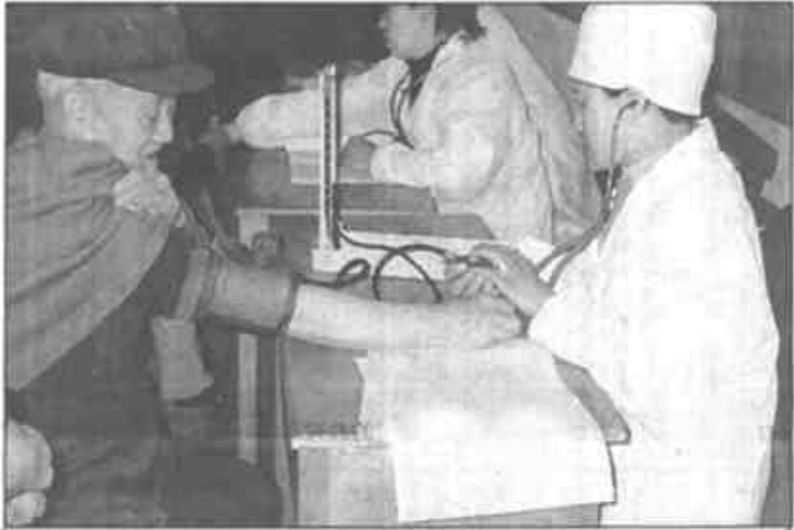
广饶县各乡镇普遍开展社区卫生服务，定期义务为农村居民健康体检，建立健康档案。图为医务人员到花园乡杜村查体。